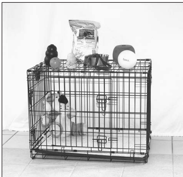
RYSUNEK 6.1. Akcesoria potrzebne przed przybyciem szczenięcia