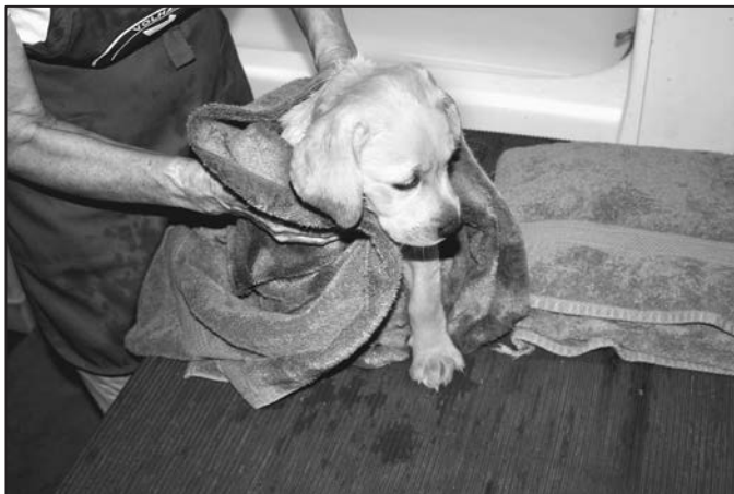
RYSUNEK 6.9. Suszenie szczeniaka po kąpielii