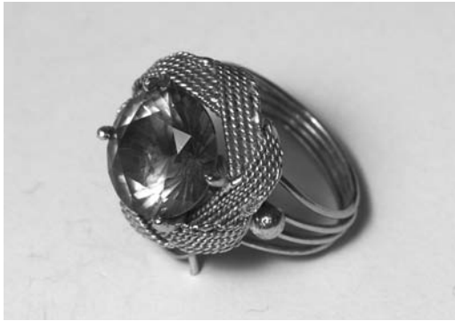
Rysunek 4. Magiczny pierścień

Włóż na rękę pierścień (albo przyjrzyj się poniższemu zdjęciu pierścienia; rysunek 4). Wyobraź sobie, że ten pierścień ma magiczną moc, i pomyśl, czego sobie życzysz, a następnie opisz to.