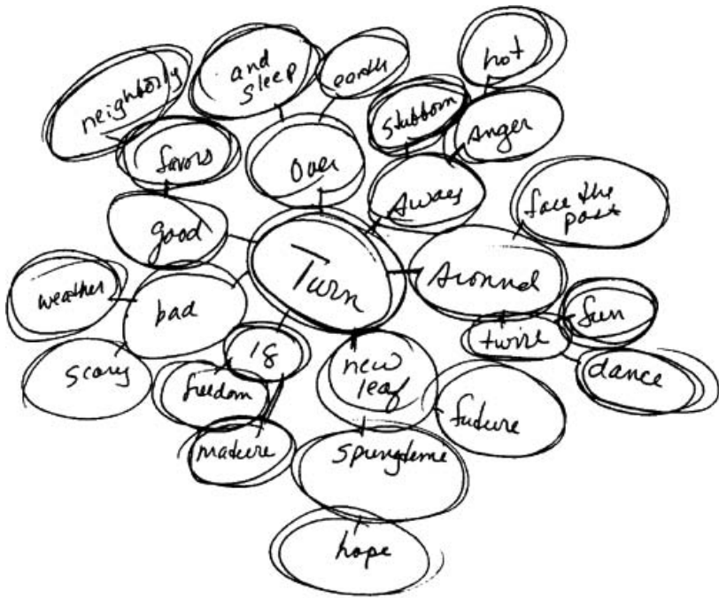
Rysunek 1. Sterowane skojarzenia 1

Weź kartkę A4, połóż ją poziomo na stole i napisz na środku, najlepiej w kółeczku, jakieś słowo, które wzbudza wiele skojarzeń, np. „słońce” albo „droga”, a następnie wypisz dookoła skojarzenia, które to słowo wywołuje, i połącz je strzałkami ze słowem początkowym. Od tych nowych słów poprowadź strzałki do kolejnych skojarzeń itd. Schemat może rozrastać się w nieskończoność. Na podstawie tych skojarzeń utwórz zdania, a następnie cały tekst. Podobnie jak w poprzednich metodach, także i w tym wypadku nie musisz dbać o zasady gramatyki i stylistyki, stwórz luźny tekst.