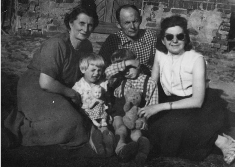
Rysunek 3. Opowieść rodzinna