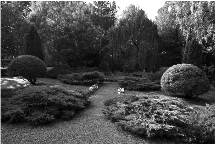
Rysunek 2. Zaczarowany ogród

Wyobraź sobie zaczarowany ogród i opisz go. Możesz posłużyć się poniższym zdjęciem (rysunek 2).