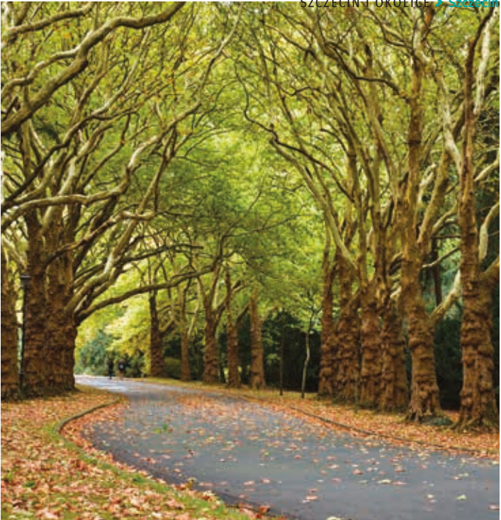
▲ Aleja platanów na Cmentarzu Centralnym

projekty cmentarza Centralnego, Wałów Chrobrego, budynku Muzeum Narodowego oraz kościoła św. Gertrudy na Łasztowni. Następnie szlak prowadzi przez wiele wymienionych wcześniej, ważnych dla historii Polski pomników. Trasa zwiedzania kończy się przy Pomniku Pamięci Kombatantów, złożonego z grotów kopii rycerskich i skrzydła husarskiego.