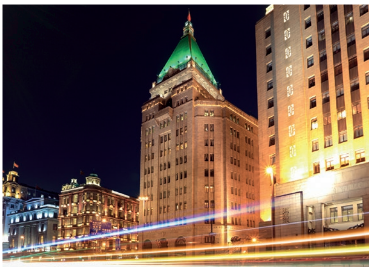
Hotel Pokoju, symbol potęgi magnata Victora Sassoon, stoi obok Banku Chin

Hotel Pokoju, arcydzieło stylu art déco (1929), jest przykładem przepychu modnego w czasach wielkiego rozwoju koncesji międzynarodowej w Szanghaju i potęgi magnata Victora Sassoon. Nad ogromną fasadą przy Nanjing donglu góruje wieża z hełmem z zielonej miedzi, pod którym mieściły się kiedyś prywatne apartamenty właścicieli. Do oszczędnej dekoracji elewacji pasuje wytworny wystrój wnętrza, z oświetleniem wzorowanym na wyposażeniu wielkiej synagogi w Damaszku, alegorycznymi witrażami, zachwycającymi dziełami Lalique'a. Sala balowa ma specjalny elastyczny parkiet, restauracja francuska zachwyca boazeriami w geometryczne wzory, a w dawnej czytelnicy, zamienionej na restaurację Dragon Phoenix, nastroj tworzą sztukaterie z chińskimi motywami.