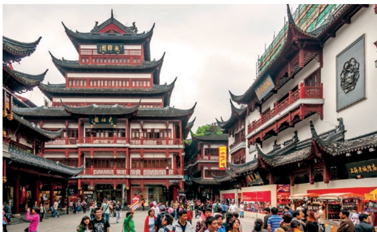
Taoistyczna Świątynia Boga Miasta

Przed bramą tej taoistycznej świątyni, wśród bazarowego gwaru, zbierają się wierni, a za ogrodzeniem tłoczą się gapie. Jest tutaj posąg Huo Guanga, słynnego generała wywodzącego się z narodu Han. Świątynia Boga Miasta składa się z kilku pawilonów, a wzniesiona została za panowania cesarza Yongle w pierwszej połowie XV w. Qin Yubo, patron Szanghaju, był administratorem Morza Wschodniego w epoce dynastii Yuan. U jego boku czczone są również bogini miłosierdzia i – przede wszystkim – bóg zdrowia.