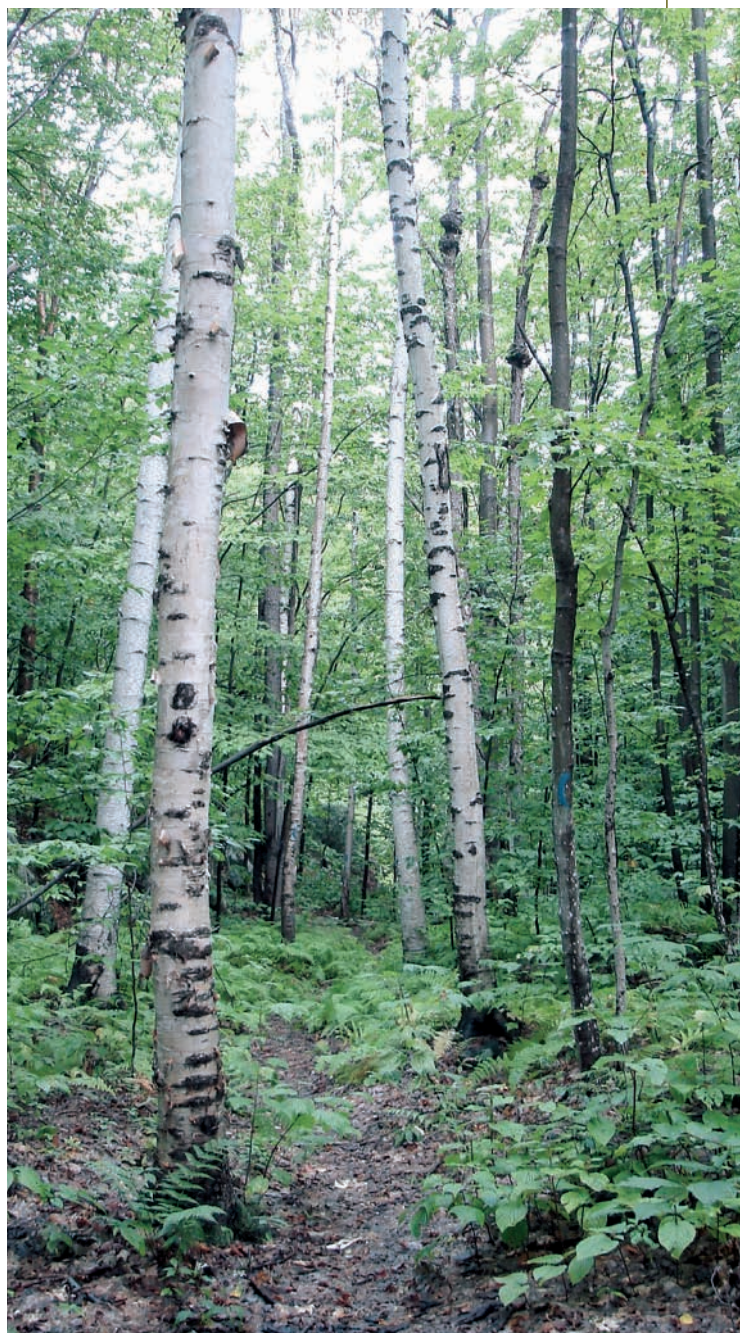
Gatunek pionierski. Brzozy brodawkowate stanowią jedno z pierwszych organizmów kolonizujących wykarczowane obszary