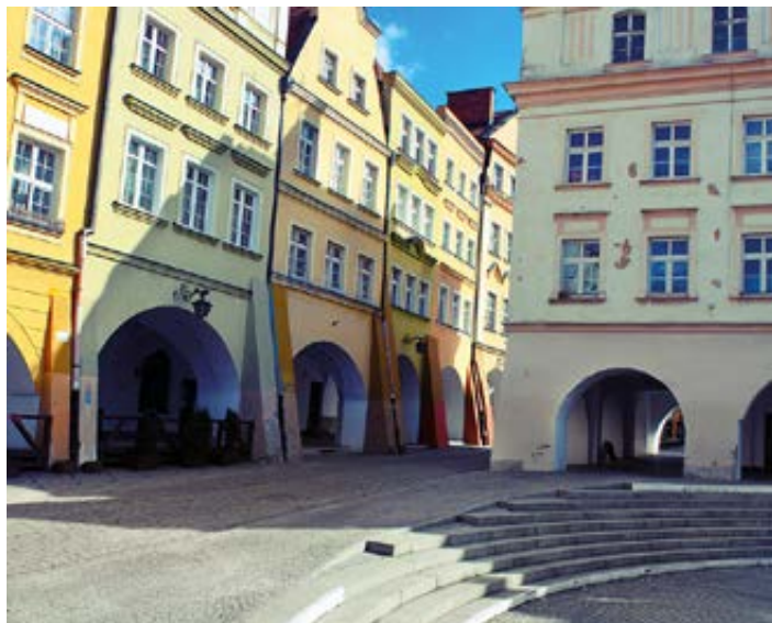
▲ Jelenia Góra, kamienice podcieniowe przy rynku