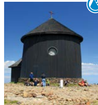
▲ Kaplica św. Wawrzyńca

Najwyższy szczyt Karkonoszy i całych Sudetów, o wysokości 1602 m n.p.m., równocześnie najwyższy punkt Czech położony na granicy z Polską. Wierzchołek jest bezleśny, pokryty gołoborzem, od polskiej strony szlak prowadzi na niego szeroką kamienną drogą. Na samym szczycie znajduje się najbardziej charakterystyczna budowla w całych Sudetach – budynek Obserwatorium Meteorologicznego na Śnieżce, o kształcie przypominającym pojazd kosmiczny. W dolnej części znajduje się restauracja, tuż obok niej kaplica św. Wawrzyńca. Już po czeskiej stronie granicy mieści się kiosk pocztowy oraz górna stacja wyciągu krzeselkowego z Pecy. Nazwa góry powstała w XIX w., a wzięła się od długo zalegającego na szczycie śniegu.