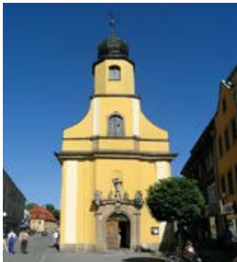
▲ Kaplica św.św. Apostołów Piotra i Pawła

Kościół otacza zadrzewiony dziedziniec z pozostałościami po cmentarzu ewangelickim. Ocalało 19 okazałych barokowych kaplic grobowych bogatych mieszczan, z których najstarsze – Glafeyów (1716) i Baumgartena (1719) – zaprojektowane zostały przez M. Frantza, autora również sąsiedniego budynku dawnej pastorówki (nr 45) i szkoły (nr 39–41).