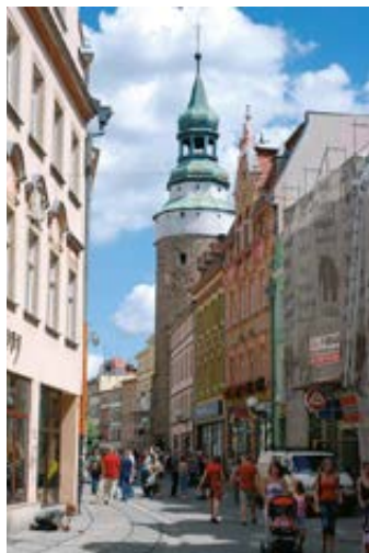
▲ Baszta Bramy Wojanowskiej

Przy zbiegu ulic 1 Maja i Klonowicza, na miejscu gotyckiej kaplicy, stoi wzniesiona w latach 1737–38 barokowa kaplica św.św. Apostołów Piotra i Pawła . Od 1948 r. jest to cerkiew prawosławna. Obecne wyposażenie pochodzi ze zniszczonych w czasie wojny cerkwi ze wschodniej Polski. W płytkiej absydzie powstały freski J. Nowosielskiego i A. Stalony-Dobrzańskiego. W ścianie zewnętrznej tkwią dwa średniowieczne kamienne krzyże z rytami: miecza i kuszy oraz drabiny. Są to typowe dla Dolnego Śląska ślady-symbolne dawnego prawa.