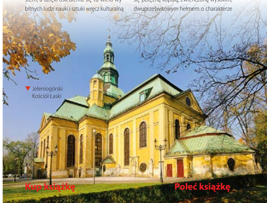
▼ Jeleniogórski Kościół Łaski

Przy ulicy 1 Maja, prawie w połowie drogi między dworcem kolejowym a centrum, wznosi się najokazalszy jeleniogórski zabitek – poewangelicki ★ Kościół Łaski pw. Krzyża Świętego , po 1946 r. jako katolicki pw. Podwyższenia Krzyża Świętego. Jest to niemal dokładna replika sztokholmskiego kościoła św. Katarzyny, zaprojektowana przez znakomitego M. Frantza i wybudowana w latach 1709–18 na planie krzyża greckiego, ale o przedłużonym ramieniu prezbiterialnym. Mimo pożaru i kilkunastu remontów (ostatni w 1997 r.) zachował pierwotną sylwetkę, która z daleka wyróżnia się potężną kopułą, zwieńczoną wysokim, dwuprześwitowym hełmem o charakterze