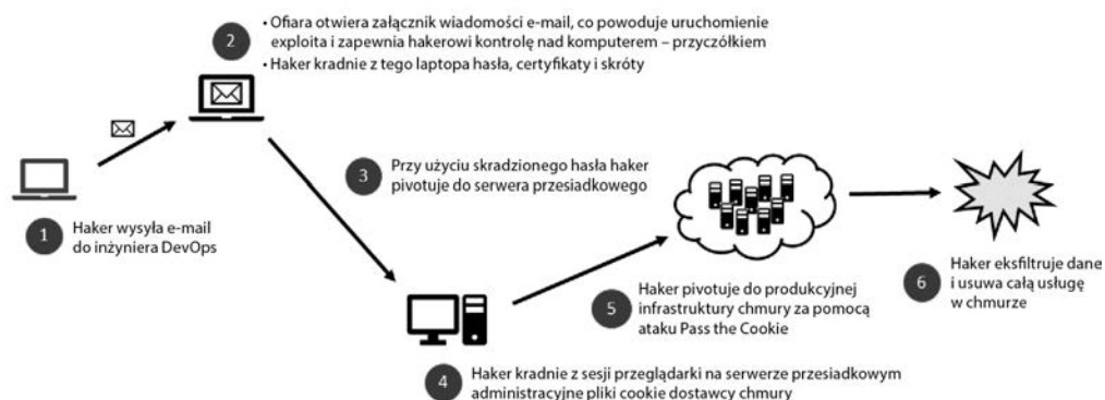
Rysunek 1.5. Graf ataku umożliwiającego włamanie się do usługi w chmurze

Jest to bardzo powszechny scenariusz ataków, który ma zastosowanie do większości organizacji. Przyjrzymy się szczegółowo różnym etapom przedstawionym na rysunku 1.5.