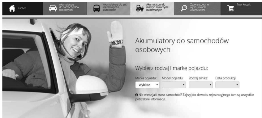
Ilustracja 1.3. Widok wyboru pojazdu

Źródło: http://www.Akuplus.com (dostęp: 20.05.2016).