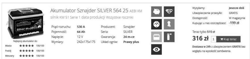
Ilustracja 1.4. Wygląd produktu

Ze względu na brak wiedzy technicznej po stronie klienta chcieliśmy, aby dobór akumulatora był bardzo prosty, a jednocześnie żeby klient miał wybór. Stąd też wpadliśmy na pomysł stworzenia dodatkowych opcji opisujących akumulator pod względem m.in. użytkowania samochodu, np. do jazdy po mieście, do wyjazdów w dłuższe trasy lub w trybie mieszanym.