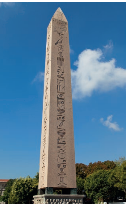
Egiptowski obelisk Teodozjusza na terenie dawnego hipodromu

Ruiny – Z obiektów stojących kiedyś pośrodku toru wyścigowego (spina) przetrwały tylko trzy. W południowej części placu wznosi się kolumna Konstantyna po turecku zwana Örne Direk, tj. „murowany obelisk”. Jest to skromny słup z grubo ciosanego kamienia, wysoki na 32 m, zapewne wzniesiony za czasów Konstantyna I. W X w. Konstantyn VII Porfirogeneta pokrył obelisk brązem, który w XIII w. krzyżowcy zdjęli i przetopili. Znacznie ciekawsza jest kolumna Wężowa (Yılanlı Sütun lub Burmalı Direk) pochodząca ze świątyni Apollina w Delfach i przedstawiająca trzy splecione węże. Pierwotnie wysoka na 8 m, utraciła cokol w czasie transportu. Głowy węży zostały częściowo zniszczone przez chrześcijan, a potem dzieła destrukcji dopełnili