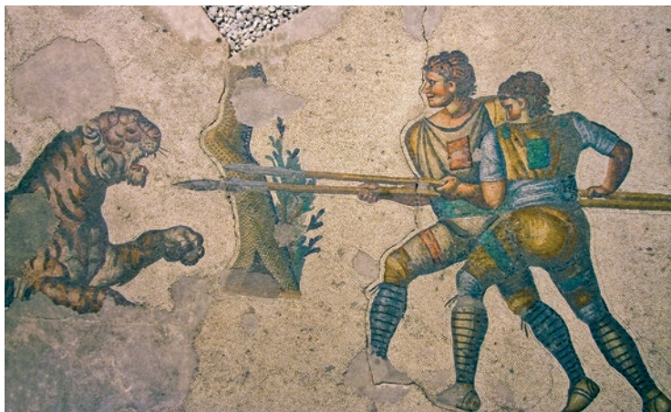
Rzymska mozaika w Muzeum Mozaik