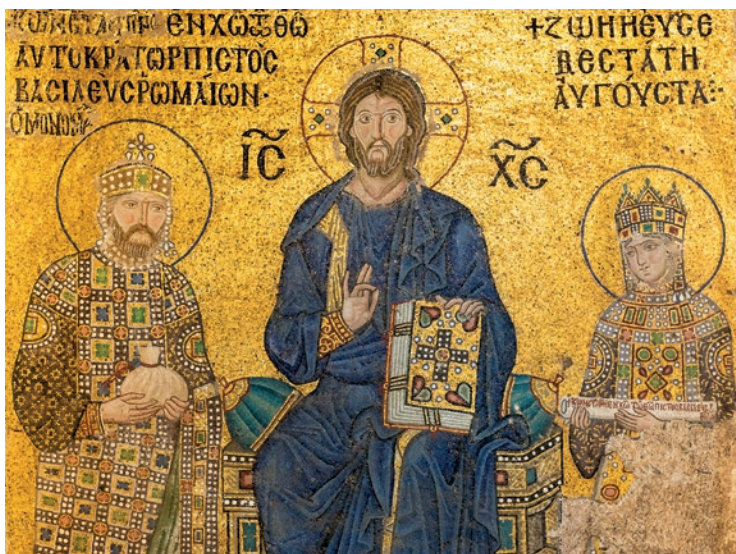
Mozaika cesarzowej Zoe

południowej , zarezerwowanej w przeszłości dla rodziny cesarskiej i najważniejszych duchownych. Wspaniała Deesis ★★ ze schyłku XII w., choć uszkodzona, nadal jest znakomitym przykładem rozkwitu sztuki za panowania dynastii Paleologów (zob. s. 52); podczas jej oglądania koniecznie trzeba przyrzeć się delikatnym rysom i bardzo ludzkiemu wyrazowi twarzy Chrystusa.