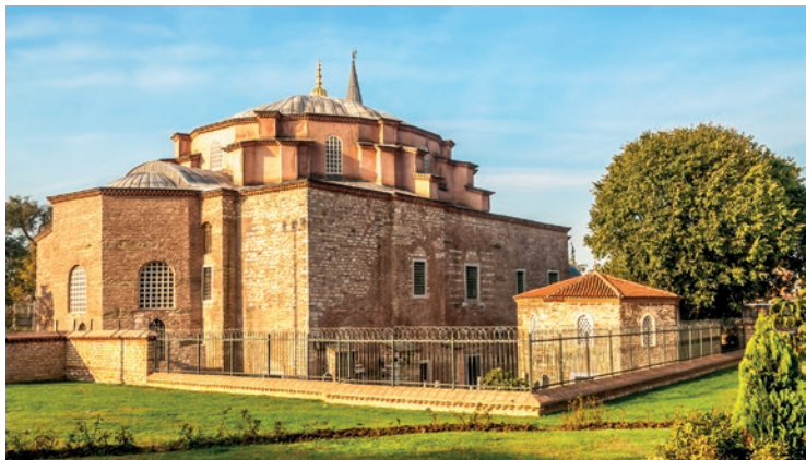
Mała Hagia Sophia

Niedawno odrestaurowany uroczy kościółek wznosi się pośrodku enklawy zieleni, z dala od miejskiego zgiełku. Turecką nazwę Mała Hagia Sophia zawdzięcza podobieństwu do dużej bazyliki (zob. s. 76). Budowę świątyni pw. św. św. Sergiusza i Bakchusa rozpoczęto w 527 r., w pierwszym roku panowania Justyniana. Była ona jednym z najważniejszych