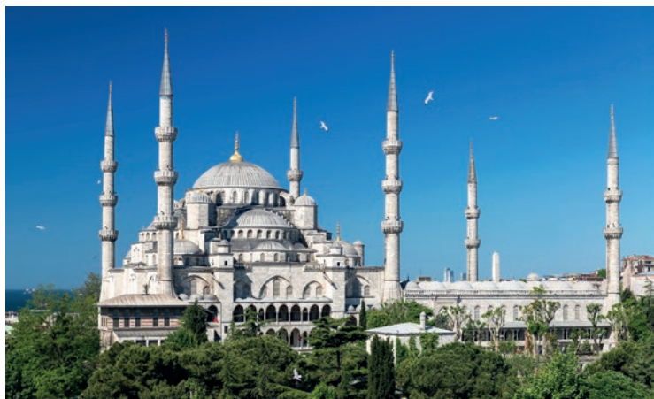
Błękitny Meczet – konkurent Hagia Sophia