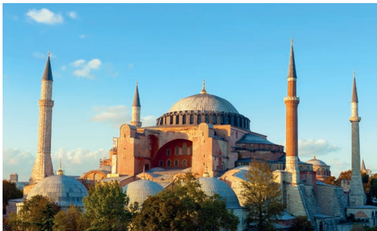
Hagia Sophia była wzorem dla architektury muzułmańskiej

Architektura – Przy budowie, która trwała 6 lat, pracowało 10 tys. robotników. Świątynię konsekrowano uroczystie 26 grudnia 537 r. Ogromna kopuła okazała się jednak zbyt szeroka i runęła podczas silnego trzęsienia ziemi w 558 r. Podczas odbudowy zmniejszono jej średnicę, jednocześnie zwiększając wysokość o 6 m (obecnie budynek ma 56 m).