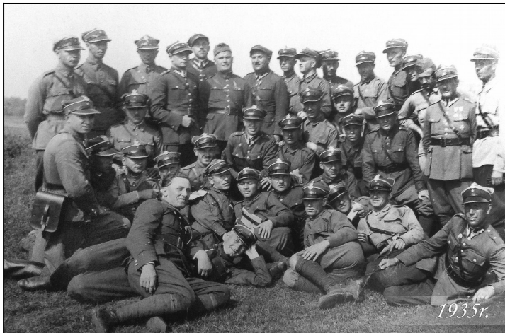
2 Pułk Piechoty Legionów Polskich. Uczestnicy ćwiczeń wojskowych w Sandomierzu. 1935 r.