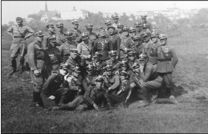
2 Pułk Piechoty Legionów Polskich. Uczestnicy ćwiczeń wojskowych w Sandomierzu. 1935 r.