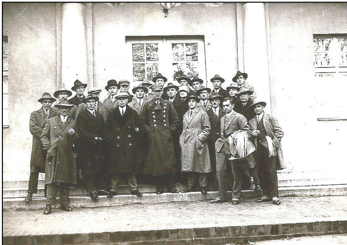
Oficerowie Wojska Polskiego. 1928 r.