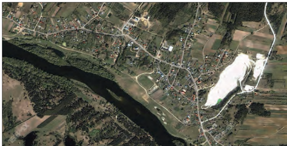
Ryc. 1. Mielnik, zdjęcie satelitarne miejscowości

wana w formie ruiny późnogotycka bryła kościoła pw. św. Trójcy zlokalizowana jest w miejscu poprzedniej świątyni. W topografii wyniesienia, pomimo znacznych przeobrażeń jego najwyższej części, wyraźnie dają się zauważyć wyodrębnione dwa człony zamku oraz przedzamcze, gdzie ulokowane było zaplecze gospodarcze. Zachowane na zboczach wyższej partii góry zamkowej ostańce kamiennych murów wskazywać mogą na pierwotną wysokość terenu zamku górnego.