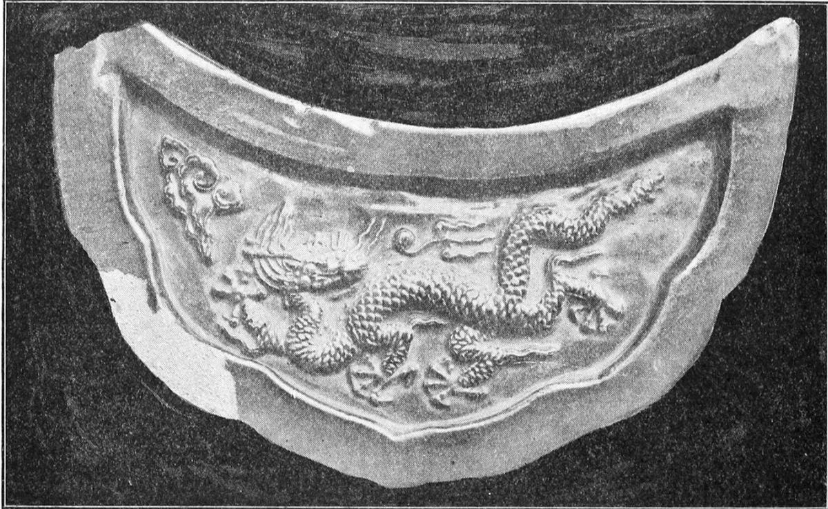
Dachówka okapowa ze smokiem

Ta płytką w kształcie półksiężyca spadła z dachu jednej z cesarskich świątyń w Pekinie. Wykonana jest z mocno glazurowanej porcelany, ma dziesięć cali średnicy i pięć cali wysokości. Jej wiek szacuje się na około dwieście lat.