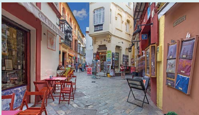
Uliczka w dzielnicy Santa Cruz

WIECZÓR. Powrót do Santa Cruz ★★★ (s. 86), aby odpocząć na jednym z placyków, usiąść na aperitif w jednym z barów i zjeść kolację w spokojnej atmosferze tej dzielnicy, gdzie czas się zatrzymał. Warto pięknie zakończyć dzień spektaklem flamenco.