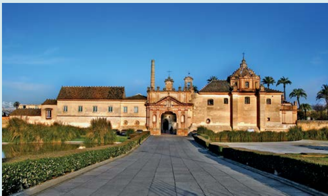
Isla de la Cartuja

Warto przekroczyć Gwadalkiwir i powędrować w kierunku wyspy Isla de la Cartuja ★ (s. 114), na której znajdują się centrum sztuki współczesnej i ogrody.