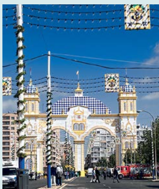
Dekoracje podczas Feria de Abril

Panorama Sewilli z Metropól Parasol oraz spacer ponad miastem na tarasie widokowym. Ultranowoczesny budynek, postawiony w samym sercu historycznego centrum, stał się jednym z symboli miasta. Nowoczesność i tradycja – oto czym jest Sewilla! Zob. s. 96.