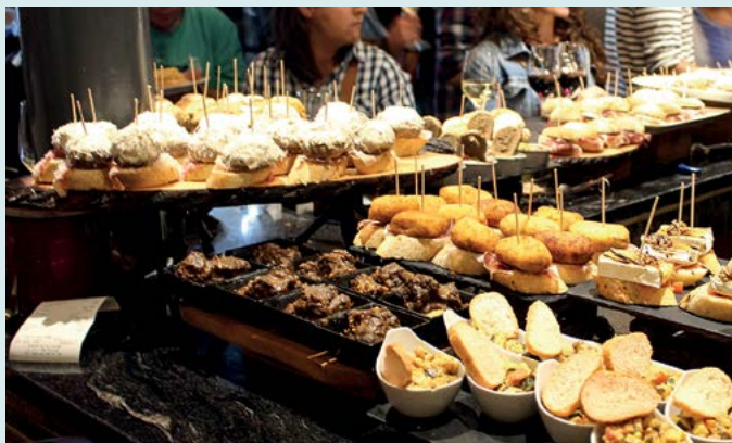
W barze tapas

Wędrówka po barach tapas wzorem prawdziwego sewilczyka. Koniecznie trzeba spróbować tapas w wielu miejscach, począwszy od klasycznych barów z dekoracją z azulejos i zawieszonymi u sufitu szynkami aż po nowoczesne lokale, w których oprócz tradycyjnych smaków można spróbować tych z elementami kuchni z całego świata. Zob. s. 74.