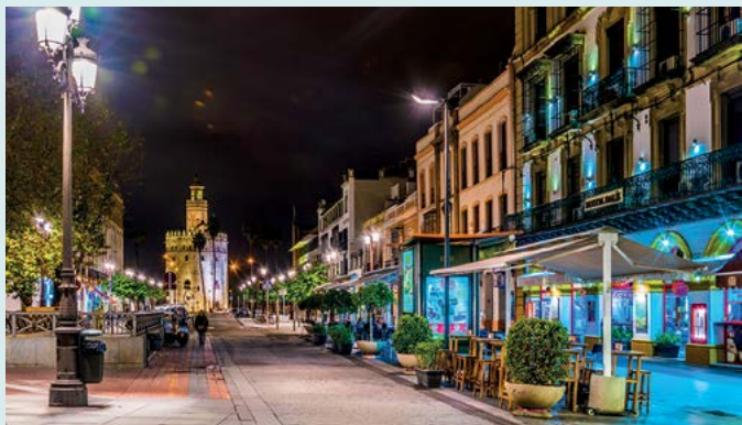
Uliczki Sewilli nocą

Wizyta w Santa Cruz nocą. Ta dzielnica to czar i magia Sewilli. Zduszone łkanie gitary, któremu towarzyszy zapach jaśminu. Sceneria jak z teatru. Wydaje się, że za chwilę pojawi się Don Juan okryty czarnym płaszczem... Zob. s. 86.