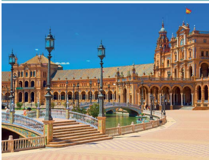
Plaza de España

Strona zawiera pięć działów poświęconych hiszpańskiej turystyce, kuchni, winom, kulturze i pogodzie. Prowadzona jest przez podróżnika, iberystę, znawcę win hiszpańskich.