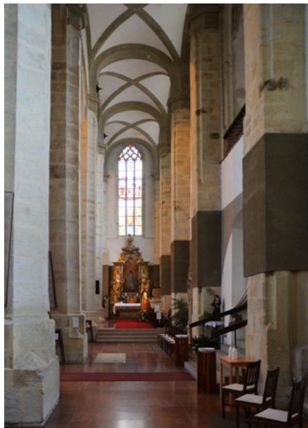
Nawa południowa, ołtarz z obrazem Czarnej Madonny Loretańskiej

Ołtarze boczne – z obrazami Madonny Loretańskiej i św. Anny z Maryją – przeniesiono z klasztoru trynitarzy po kasacie zakonu.