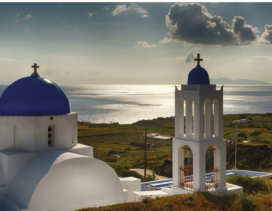
▲ Wschód słońca nad Vourvoulos

Na placu miejskim znajduje się tradycyjny młyn wiatrowy i tablica upamiętniająca poległych w czasie II wojny światowej. Po lewej stronie, za wyjściem z placu, droga ostro skręca w lewo i daje początek „Schodom Galaiosa”, które prowadzą do starej części Karterados z brukowanymi uliczkami, pięknymi rezydencjami kapitanów i wbudowanymi w skałę domami w jaskiniach.