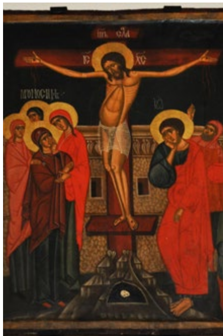
Wystawa sztuki cerkiewnej