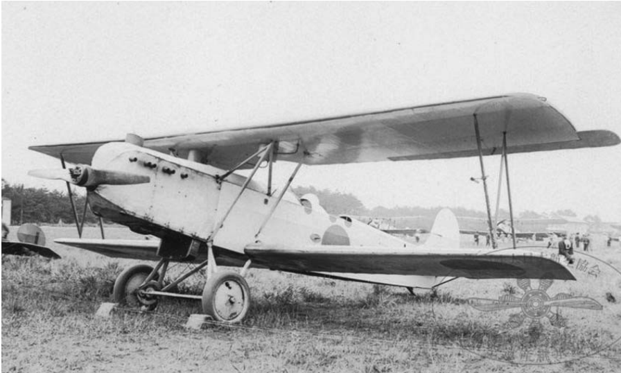
Rysunek 1: Japoński egzemplarz testowy

Wkrótce pojawiły się kolejne powojenne konstrukcje opracowane przez słynnego Reinholdta Platza, międzywojennym. Sam projekt powstał w roku 1924 jako kontynuacja poprzedniego typu Fokker C-IV. Pierwszy prototyp