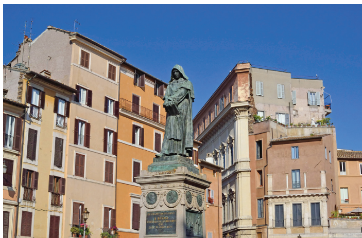
▲ Posąg Giordana Bruna

Czesława Miłosza. Niegdyś odbywały się tu publiczne egzekucje, turnieje i zgromadzenia, a od połowy XIX w. popularny