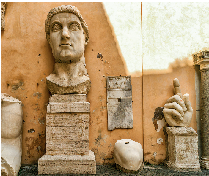
▲ Fragmenty posągu Konstantyna Wielkiego

Parter mieści galerię rzeźb, wśród których zgromadzone są m.in. Spinario , czyli Chłopiec wyjmujący cierń z nogi (I w. p.n.e.); etruski, brązowy posąg Wilczycy kapitołńskiej (początek V w. p.n.e.), do którego w XV w. dodano figurki Romulusa i Remusa, czy popiersie Meduzy autorstwa Berniniego oraz oryginał brązowego konnego posągu Marka Aureliusza (II w. n.e.), którego kopia stoi na Piazza del Campidoglio. W sali Horatii e Curatii podziwiać można fresk D'Arpina (1613) przedstawiający legendarną walkę Horacjuszy z Kuriacuszami, a także posąg papieża Urbana VIII Berniniego.