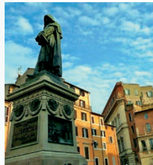
Campo dei Fiori Pomnik Giordana Bruna.