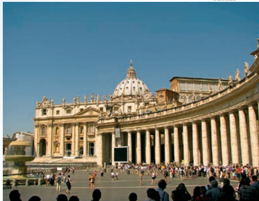
Capella Sistina Wejście do kaplicy znajduje się po prawej stronie bazyliki San Pietro.

Na ścianie ołtarzowej kaplicy można zobaczyć Sąd Ostateczny ukończony przez Michała Anioła ok. 1540 r. To niezwykle dzieło, w centrum którego znajduje się wizerunek Chrystusa z Matką u boku, oddaje niepokoję bliższe nadchodzącej już epoce baroku. Zaskakuje symetria fresku, należy zwrócić też uwagę na ruch postaci w górę (zbawieni) i w dół (potępieni). Św. Bartłomiej trzyma w rękę własną skórę (zginął męczeńską śmiercią obdarty ze skóry) – co ciekawe, jest to autoportret samego Michała Anioła.