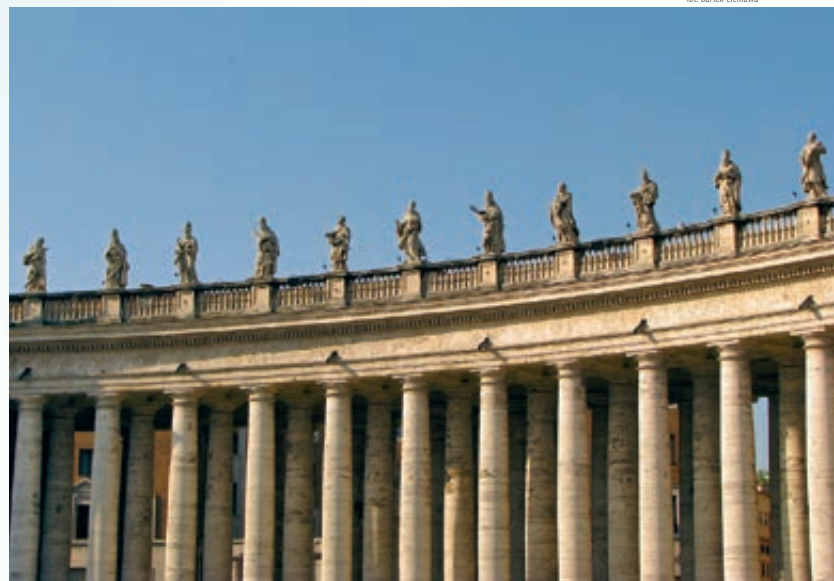
Basilica di San Pietro Rzeźby Berniniego wieńczące kolumnadę w pobliżu największej bazyliki Rzymu.