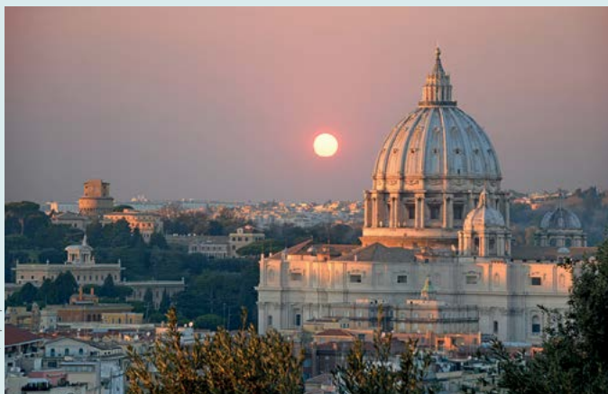
Zachód słońca widoczny ze wzgórza Janikulum

Podziwianie zachodu słońca ze wzgórza Janikulum przy lampce wina, w małej kawiarence z widokiem na Wieczne Miasto (s. 118).