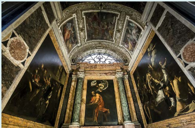
Kościół S. Luigi dei Francesi

Podziwianie dzieł Caravaggia w kościele S. Luigi dei Francesi, w którym znajdują się trzy obrazy przedstawiające wydarzenia z życia św. Mateusza (s. 84).