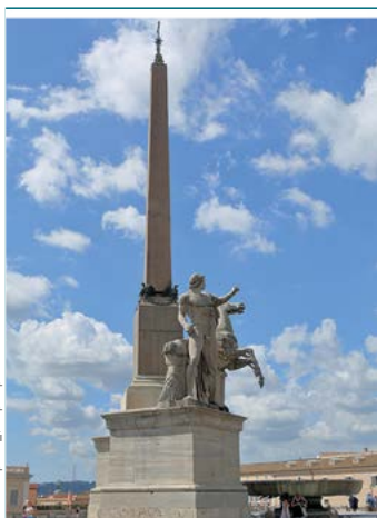
Obelisk na Kwirynale

Rzym liczy niemal 3 mln mieszkańców, czyli ponad połowę populacji regionu Lacjum , którego jest stolicą. Pomimo tej liczby, to pierwsze miasto we Włoszech nie doświadczyło takiego rozwoju przemysłowego, jak Mediolan czy Neapol. Stało się tak z powodu nakazów ochrony i konserwacji istniejących tu zabytków, których wartość jest nie do przecenienia. Gospodarka Rzymu opiera się na sektorze usług , co jest szczególnie widoczne od momentu, gdy w 1871 r. miasto zostało podniesione do rangi stolicy zjednoczonych Włoch. Od tego czasu zaczęła się intensywnie rozwijać działalność związana z rolą polityczną i kulturalną miasta, obejmująca m.in. kino (Studios Cinecittà) czy rynek wydawniczy . Jednocześnie całe dzielnice były poddawane przebudowie, aby pomieścić nową administrację . Przykładem tego są obszary wokół dworca Termini oraz via Nomentana.