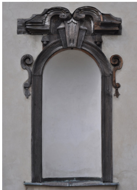
Nisza elewacji południowej