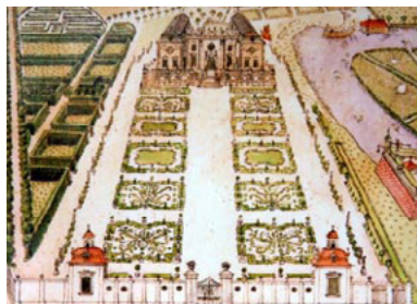
Pałac z ogrodem, frontową bramą i dwoma kordegardami; źródło: Tryptyk Wiedemanna, z 1762, w Muzeum Okręgowym w Rzeszowie