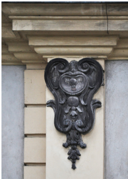
Detale elewacji zachodniej

Okręgowa Izba Lekarska niektóre pomieszczenia wynajmuje innym użytkownikom, m.in. w piwnicach urządzono restaurację.