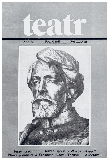
Il. 1. Okładka czasopisma „Teatr” (1983, nr 1)