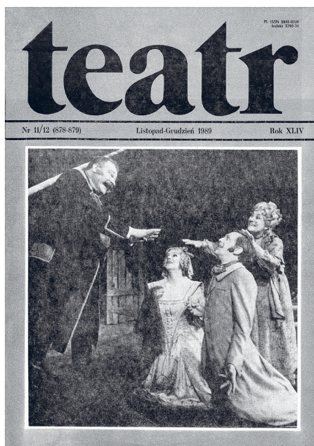
Il. 2. Okładka czasopisma „Teatr” (1989, nr 11/12)