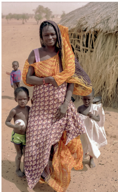
📷 Mieszkanka Mauretanii

Przeglądając jego zdjęcia, nie sposób nie trafić na kobiece portrety. Panie uśmiechają się, poważnie patrzą w obiektyw, ukrywają wzrok. Czasem ich twarz przysłania udrapowany kawałek tkaniny, czasem głowę zdobi misternie i ze smakiem skomponowana fryzura. Przed oczami przesuwają się szeregi typów urody, reprezentacja miejsc na mapie świata. Uzupełniają go sceny z codziennego życia, w którym dominują zajęcia tradycyjnie przypisywane przedstawicielkom płci żeńskiej – wyszywanie makatek, suszenie ziarna, pielienie przydomowych ogródków. Nie brak też kadrów poświęconych macierzyństwu, gdyż w tradycyjnych społecznościach wiecznie zapracowanej matce towarzyszy jej pociecha. Zawinięta w chustę na plecach, trzymająca się matkowej spódnicy. Niektóre z tych zdjęć zauważyłem później podczas werutowania kolejnych numerów czasopisma „Poznaj Świat”. Nie muszę zgadywać, kto jest ich autorem.