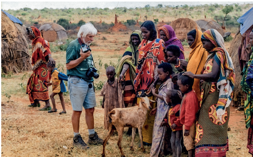
📍 Spotkanie z kobietami w wiosce w dolinie rzeki Omo w południowej Etiopii

Potem nawiązuje do pewnego specyficznego aspektu świata pełnego kobiet: – W małych miejscowościach, dalekich od naszej cywilizacji, występuje stały problem: opuszczenie wspólnoty przez mężczyzn w sile wieku. Kiedy naturalny sposób życia oparty na samowystarczalności się zakłóci i potrzebne są pieniądze, to mężczyzna musi iść do pracy. W kopalni, na roli... Początkowo wraca do swojej rodziny, potem, z upływem czasu, w ogóle o niej zapomina. Spotykałem takie miejscowości w Afryce, w dolinie rzeki Omo, w Lesotho i w Swazilandzie 96 , gdzie w większości byli tylko chłopcy i starcy. Dzięki temu w sposób naturalny mogłem rozmawiać z kobietami.