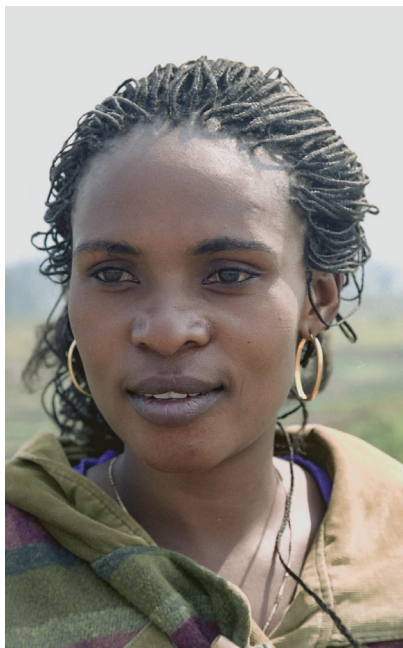
📷 Mieszkanka Bukavu (Zair)