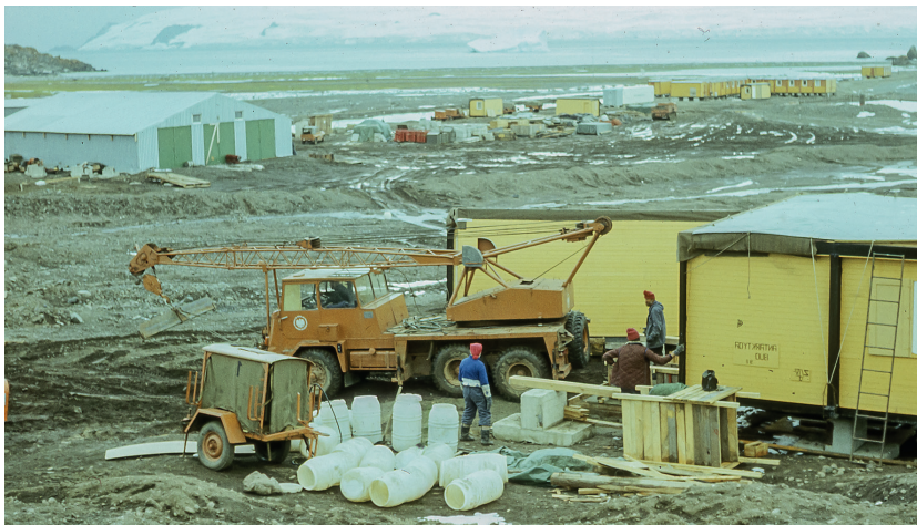
📍 Antarktyczny plac budowy

polarne były i są organizowane przez entuzjastów. A ludzie wiedzeni ideą są w stanie pracować z większym poświęceniem.