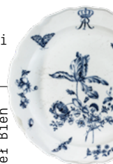
Półmisek z warszawskiego serwisu Augusta III, Królewska Manufaktura Porcelany w Miśni, ok. 1750

46 Dusza w drewnie, robak w kantacie Paweł Bien