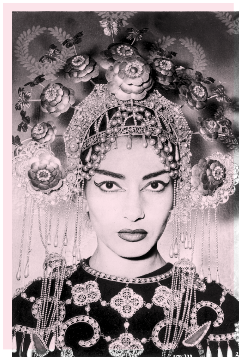
Maria Callas jako księżniczka Turandot