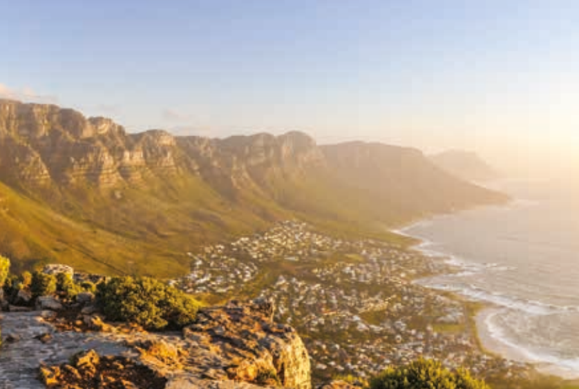
Góra Stołowa

cja wnętrza robotniczego mieszkania) wystawa ukazuje – w poruszający sposób – współistnienie różnych społeczności i intensywne życie wspólnotowe, sportowe i kulturalne. Największa część Dystryktu Szóstego wciąż czeka na odbudowę, do życia powołano stowarzyszenie, którego celem jest umożliwienie dawnym mieszkańcom i ich rodzinom powrotu do dystryktu.