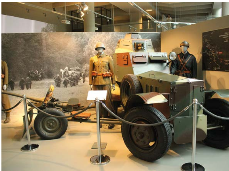
▲ Część ekspozycji Muzeum Fortyfikacji i Broni

parking. Widać stąd wejście do miasta poprzez most nad fosą i masywną, ceglano-kamienną Bramę Szczepreską . To ostatnia z bram zaprojektowanych przez Moranda, ukończona w latach 1603–05, już po jego śmierci. Surowa, pozbawiona dekoracji architektura podkreśla obronną funkcję budowli. Ten wygląd to efekt przebudowy w stylu klasycystycznym po 1820 r.