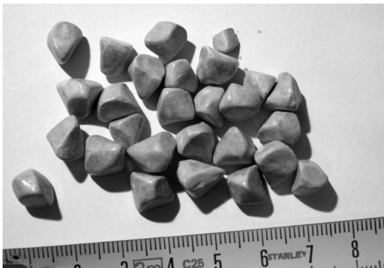
Ilustracja 1d: Wypłukane kamienie (twarde, zwapnione kamienie)