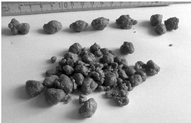
Ilustracja 1c: Wypłukane kamienie (miękkie kamienie cholesterolowe)

Kamienie w wątrobie, które Uniwersytet Johna Hopkinsa i inne szkoły medyczne nazywają wewnątrzwątrobowymi kamieniami żółciowymi lub kamieniami żółciowymi 9 , mają tendencję do zlepiania się i tworzenia dużych blokad, które mogą prowadzić do rozszerzenia przewodów żółciowych (zobacz ilustracja 1a). Wewnątrzwątrobowe kamienie żółciowe składają się głównie z cholesterolu i innych elementów żółci (zobacz wynik laboratoryjny – ilustracja 1b).