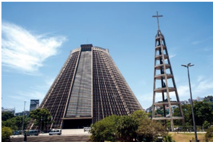
Catedral Metropolitana de São Sebastião