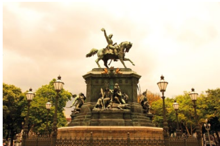
Pomnik Tiradentesa przed Palácio Tiradentes

Z praça XV przechodzimy esplanadą pod av. Presidente Alfred Kubitschek i dochodzimy do portu załadunkowego promów odbijających w stronę Niterói i Ilha de Paquetá. Żółta fasada Estação das Barcas zdobi dzielnicę. Stąd rozciąga się jeden z najlepszych widoków na most Niterói i Ilha Fiscal. Espaço Cultural da Marinha znajduje się w dawnych dokach urzędu celnego i mieści małe muzeum morskie . Nieco dalej widać ośmioboczną wieżę Restaurante Alba Mar (zob. s. 58), która jest ostatnim śladem starego miejskiego rynku.