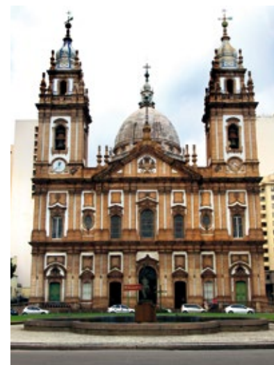
Igreja de N.S. da Candelária

Kościół znajduje się na terenie sanktuarium, powstałego w 1634 r. jako wotum dziękczynne kapitanu okrętu, który cudownie ocalał podczas sztormu. Kościół wzniesiono w 1775 r. Wielokrotnie odnawiany, w XIX w. został zwieńczony okazałą kopułą. Do czasów współczesnych zachowała się jedynie oryginalna fasada. Połączenie baroku i neoklasycyzmu oraz wewnętrzny wystrój z marmuru wyróżnia ten kościół spośród charakterystycznych portugalskich zdobień rzeźbiorskich w drewnie. Całość swym przepychem robi imponujące wrażenie.