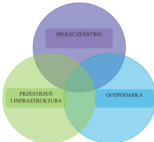
Rys. 1. Podejście zintegrowane w polityce miejskiej: przestrzeń i infrastruktura, gospodarka, społeczeństwo

Rewitalizacja jest pojęciem szerszym znaczeniowo od tych wymienionych powyżej. Prawidłowo realizowana ma charakter zintegrowany i obejmuje kompleksowe procesy odnowy, prowadzone w partnerstwie w obszarach miejskich, wiążące działania techniczne (budowlane) z przedsięwzięciami na rzecz ożywienia społeczno-gospodarczego 15 . Poniższy rysunek obrazuje zintegrowane podejście do procesów rewitalizacji.