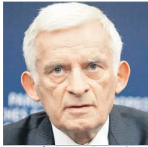
prof. Jerzy Buzek poseł Parlamentu Europejskiego, był jego przewodniczącym w latach 2009-2012, premier RP w latach 1997-2001