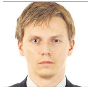
Piotr Zygałdo wicedyrektor Departamentu Koordynacji Wdrażania Funduszy Unii Europejskiej w Ministerstwie Rozwoju Regionalnego