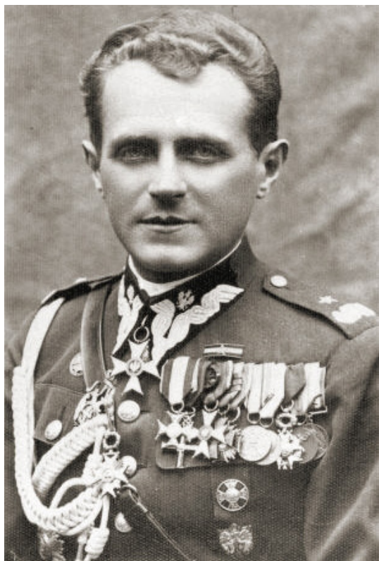
Michał Karaszewicz-Tokarzewski