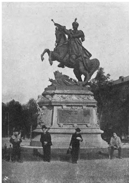
Pomnik króla Jana III Sobieskiego we Lwowie około 1905 roku