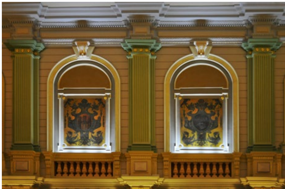
Detale hali głównej

Polichromie w restauracji dworcowej wykonał przemyski malarz, grafik, projektant Marian Stroński (1892–1977).