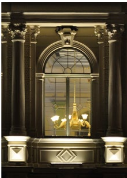
Okno hali głównej