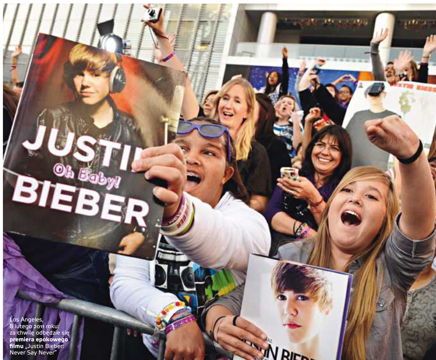
Los Angeles, 8 lutego 2011 roku: za chwilę odbędzie się premiera epokowego filmu „Justin Bieber: Never Say Never”