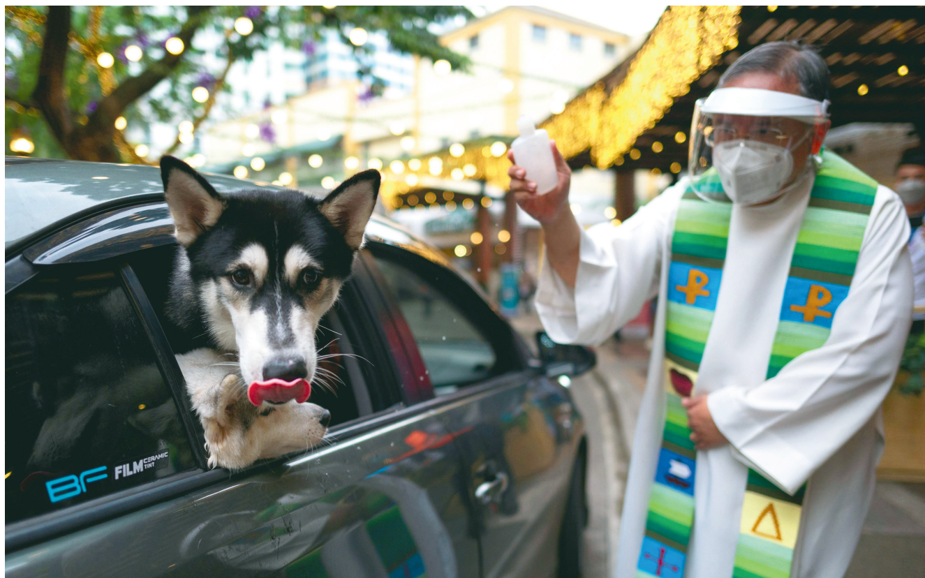
Błogosławienie zwierząt domowych przed Świątym Dniem Zwierząt, Quezón City, Filipiny, 3 października 2021 r.