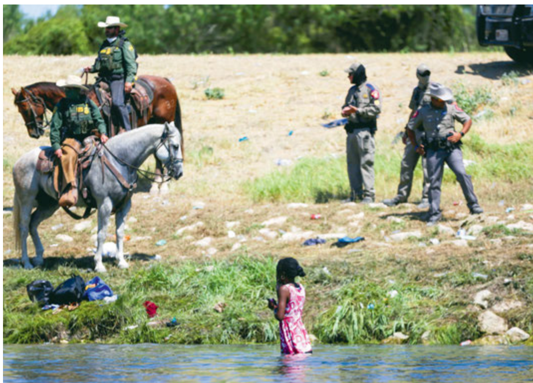
Migrantka kąpie się w rzece Rio Grande, Acuña, Meksyk, 19 września 2021 r.