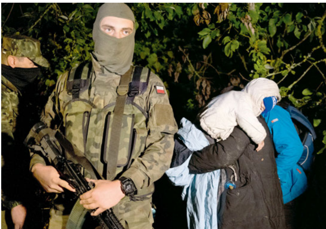
Jurowlany, interwencja Straży Granicznej wobec uchodźców.