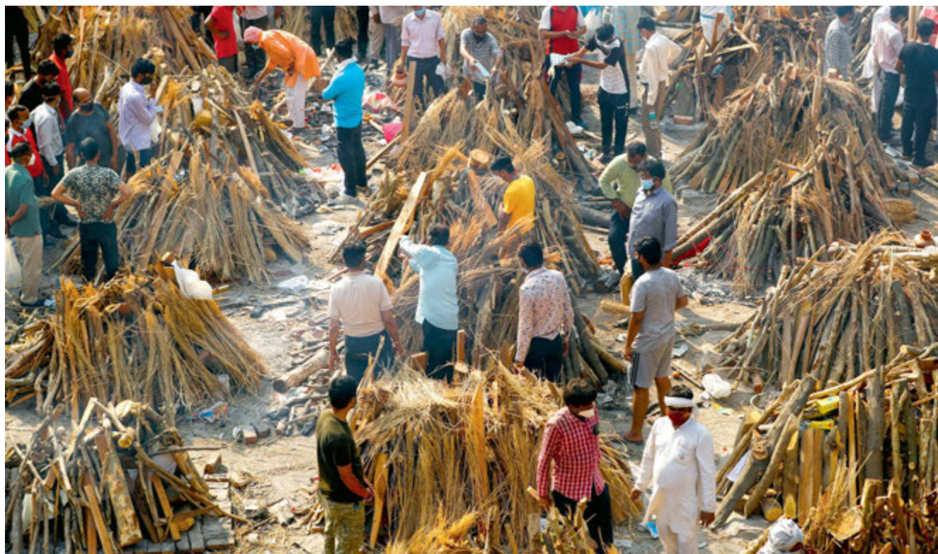
Indyjska odmiana koronawirusa sieje spustoszenie, w całym kraju płoną stosy pogrzebowe. Nz. masowa kremacja w New Delhi.