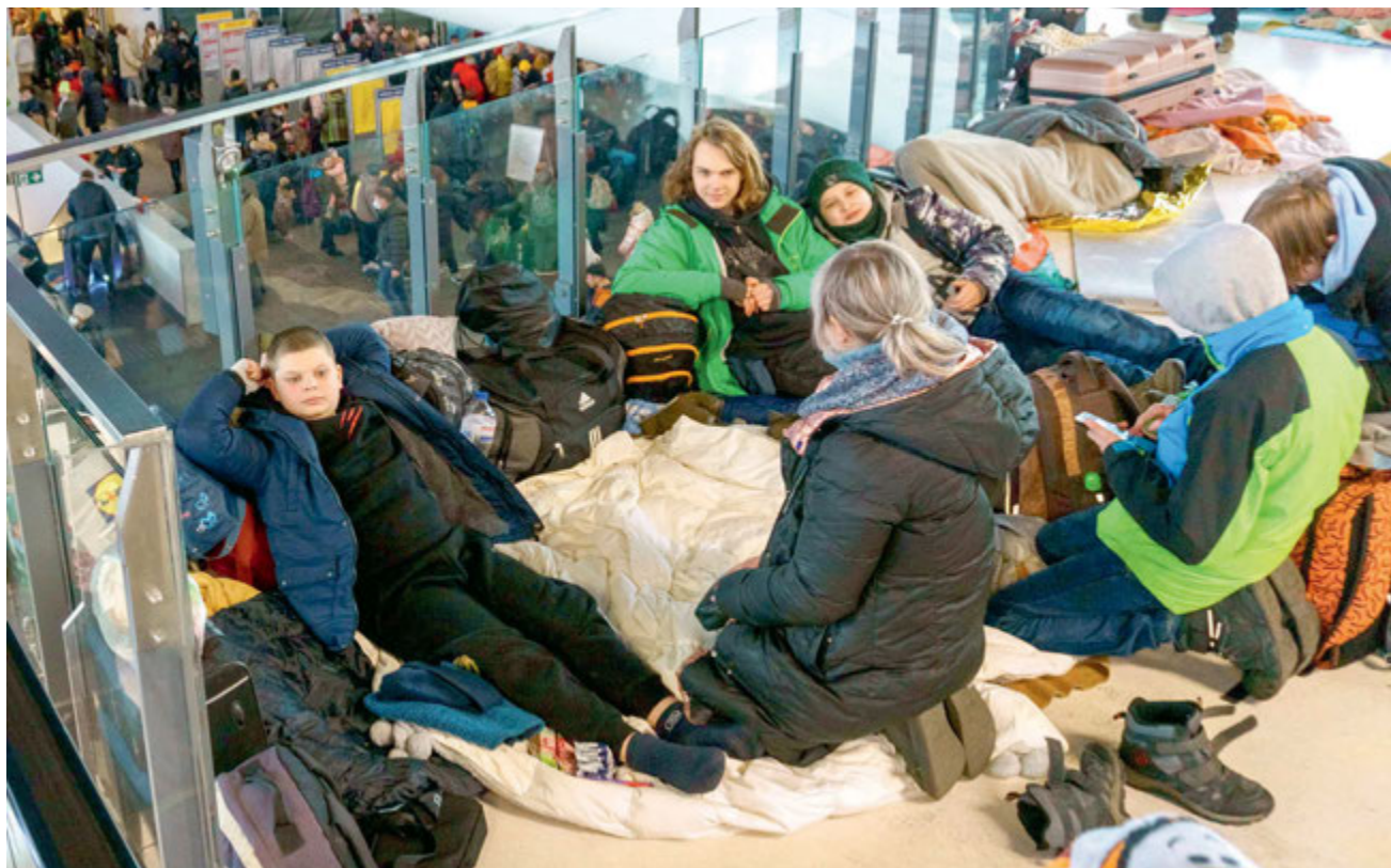
Uchodźcy z Ukrainy koczują na Dworcu Centralnym w Warszawie.