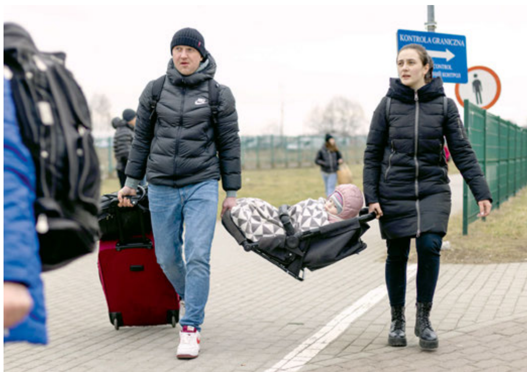
Uchodźcy na granicy polsko-ukraińskiej w Medyce, 25 lutego 2022 r.