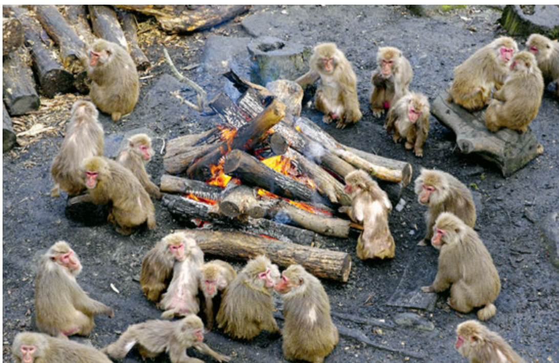
Grudzień przy ognisku w Japońskim Centrum Małp w mieście Inuyama.