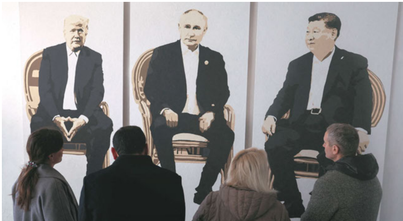
Wystawa „Jafta 2.0” w podjałtańskiej Liwadii. W 1945 r. w tamtejszym pałacu konferowali Stalin, Churchill i Roosevelt. Nowa Wielka Trójka to Trump, Putin i Xi Jinping. 8 lutego 2025 r.