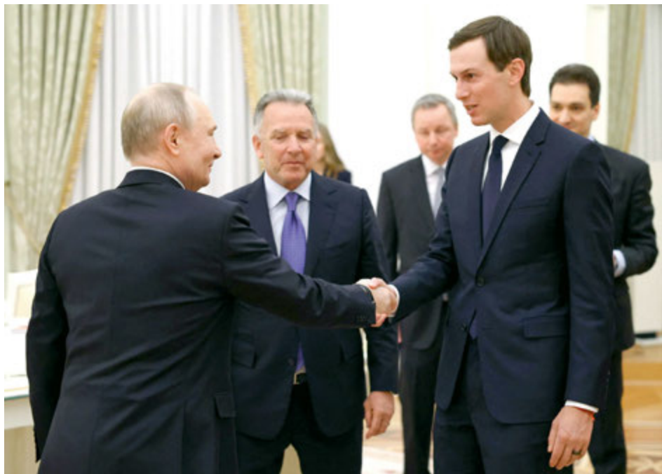
Prezydent Rosji Władimir Putin wita specjalnego wysłannika USA Steve'a Witkoffa i zięcia Donalda Trumpa Jareda Kushnera, Moskwa, Kreml, 22 stycznia 2026 r.