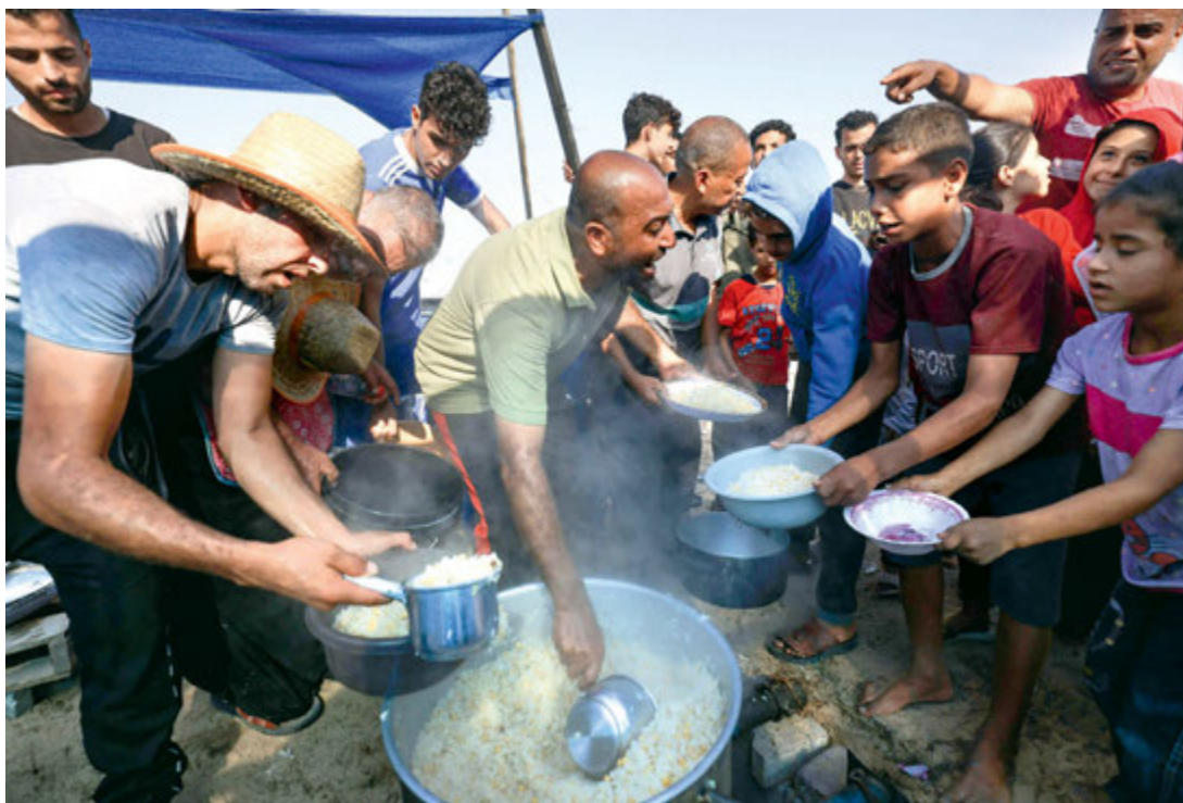
Prowizoryczny obóz dla palestyńskich przesiedleńców w Chan Junus na południu Strefy Gazy, 25 października 2023 r.