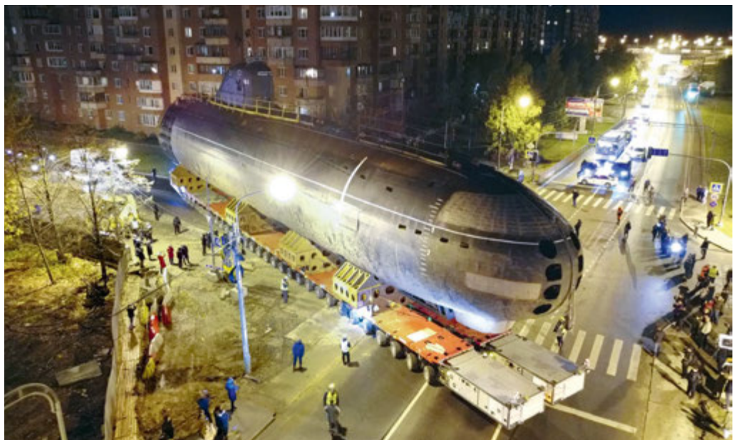
Okręt podwodny Leninskij Komsomol przetransportowano ulicami Sankt Petersburga do muzeum w Kronsztadzie. Rosja, 12 października 2022 r.