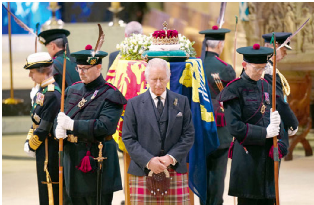
Król Karol III i królewscy łuczownicy czuwający przy trumnie Elżbiety II. Edynburg, katedra św. Idziego, 12 września 2022 r.