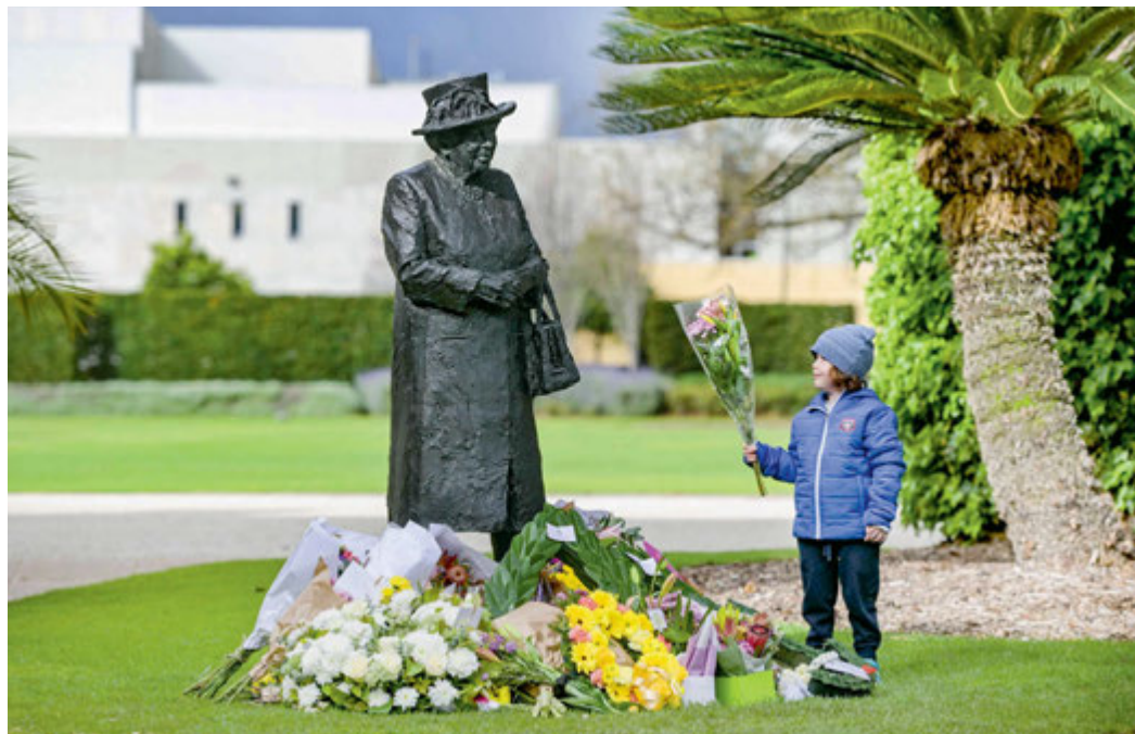
Commonwealth żegna swoją królową. Adelaide, Australia Południowa, 9 września 2022 r.