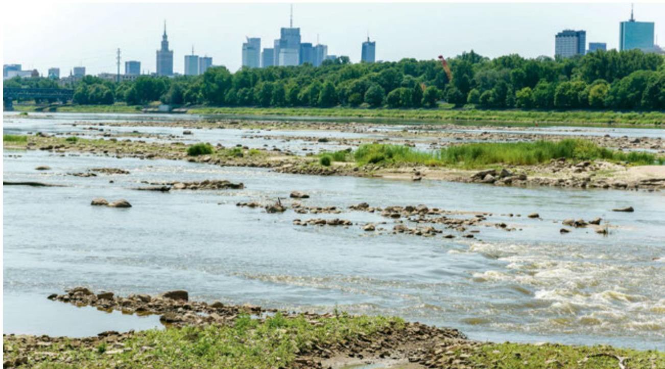
To jeszcze Wisła czy już Wisetka? Bardzo niski poziom wód królowej polskich rzek. Warszawa, 21 lipca 2022 r.