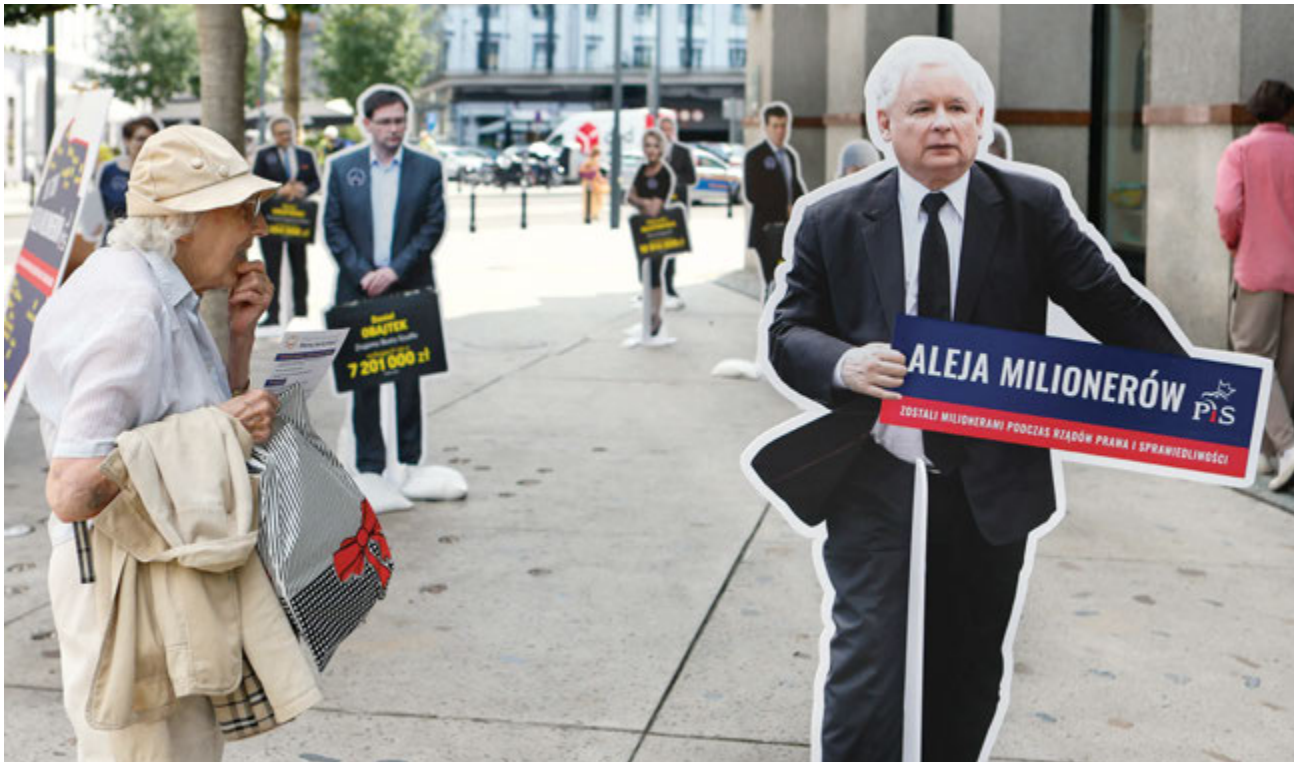
Aleja Milionerów. Ty pracujesz, oni się bogacą – akcja zorganizowana przez Platformę Obywatelską. Warszawa, plac Pięciu Rogów, 12 lipca 2023 r.