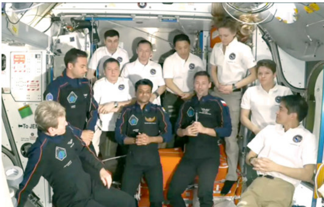
Drugi Polak w kosmosie. Sławosz Uznański- -Wiśniewski z załogą misji Axiom-4 na pokładzie Międzynarodowej Stacji Kosmicznej, 26 czerwca 2025 r.